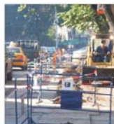
Peste 67 milioane RON, investiții în infrastructura județului Galați