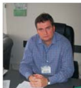
Județul Brașov, pe primul loc la procesarea produselor de origine animală