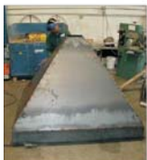
"Anticovosiv" București va investi un milion de dolari în modernizare, pînă la sfîrșitul anului