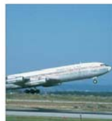
A încetat greva de la "Boeing"