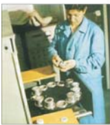
Piața produselor "Carbochim" Cluj Napoca a crescut