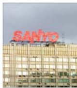
10.000 de disponibilizați la "Sanvo Electric"