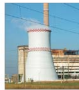
Aproape 900.000 RON vor fi investiți în rețeaua termică din Arad