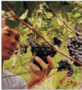
Industria vinului va înregistra pierderi de circa 450 milioane RON