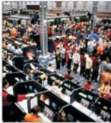
Tot mai multe tranzacții la London Stock Exchange