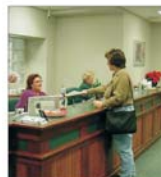
Basel II îngreunează accesul IMM-urilor la finanțare bancară