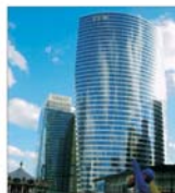
"Electricitate de France" preia "Motor-Columbus" în schimbul unui miliard de dolari