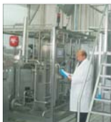
"Covallact": Consumul de lactate din țara noastră - la un nivel scăzut față de media europeană