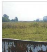
800 de apartamente pentru tineri, în Voluntari