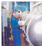
"Mittal Steel" Galați este principalul client al "Hidroșib"