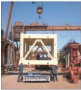
Anul trecut, ulajul minier a asigurat 28% din cifra de afaceri a "Unio" Baia Mare