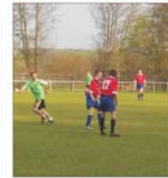
Baza sportivă din parcul Brăsovean Tractorul va costa peste 1 milion de euro