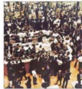
Marile oțelării din Rusia se pregătesc să lanseze oferte la Bursa din Londra