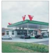
Comerțul bilateral dintre România și Ungaria va depăși 2,5 miliarde de euro