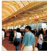
Banca Mondială, mult mai pesimistă în privința beneficiilor unui acord comercial global