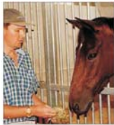
Agricultura va avea un buget de 28.500 miliarde de lei