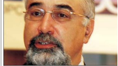
VARUJAN VOSGANIAN, PREȘEDINTELE COMISIEI BUCET, FINANȚE, BĂNCI DIN CADRUL SENATULUI:

Procedura de declarare a falimentului și lichidarea Băncii Internaționale a Religiiilor (BIR) au fost făcute în mod fraudulos, susțin senatorii PSD Rodica Stănoiu și Ion Bășgan, din cadrul Comisiei pentru cercetarea abuzurilor, combaterea corupției și petițiilor. Aceștia au înaintat săptămîna trecută președintelui Senatului, Nicolae Văcăroiu, o scrisoare prin care solicită aprobarea de către Biroul Permanent al Senatului a documentației ce cuprinde Raportul Coman și Proiectul de Hotărîre adoptate de Comisia