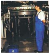
Datorile "Zarea" au fost eşalonate pînă în 2008