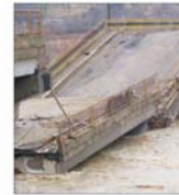
Compania Națională de Autostrăzi: Două treimi din podurile naționale sînt vechi!