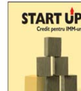
PRIMA bancă a idelilor noi