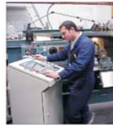
IMM-urile nu se sperie de piața europeană