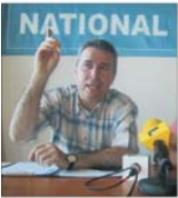
Sindicaliștii de la "Romero" pichetează sediul SIF "Muntenia"