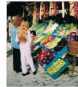
Piața Motache va fi modernizată

Glorios nu este acel om care nu cade niciodată, ci acela care se ridică de fiecare dată când cade. Confucius