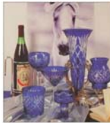
Peste 90% din produsele "Falmar" merg la export