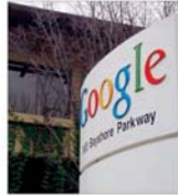
Valoarea de piață a companiei "Google" se apropie de 100 de miliarde de dolari