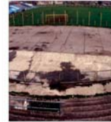
"Kaufland" a cumpărat un teren de peste 3 milioane de euro în Arad