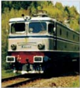
Companiile de transport feroviar sînt principalii clienți ai "Remarul 16 Februarie"