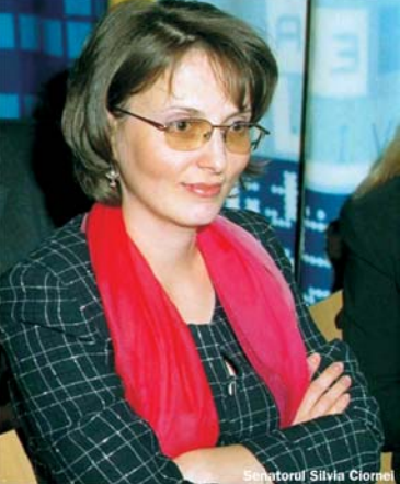
Senatorul Silvia Ciornei