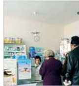
1.000 de farmacii din țară, în pericol să fie închise