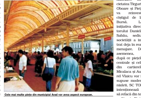
Cele mai multe pietre din municipiul Arad vor avea aspect european.