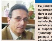
CiHii, în pagina 3, articolul "Băieții cu chibrituri", semnat de Cornel Codrîi.