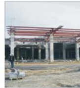
În băneasa se construiește un nou Centru Comercial "Carrefour"