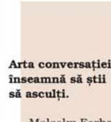
Arta conversației înseamnă să știi să ascuți.