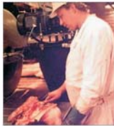
Crește consumul de carne de porc