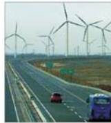
China va investi 180 de miliarde de dolari în resurse de energie regenerabilă