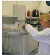
Afacerile în industria produselor chimice s-au redus cu peste un sfert