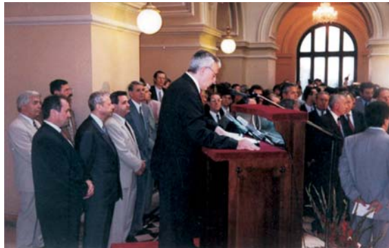
Fotografie document de la inaugurarea festivă a BVB cu zece ani în urmă...