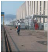
"Electromontaj Carpați" Sibiu activează de 55 de ani în domeniul electricității