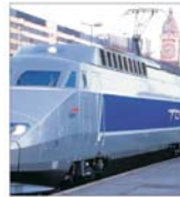
Grevă la Căile Ferate Franceze