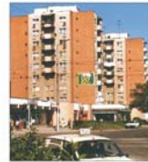
Plaja imobiliară din Arad este tot mai activă