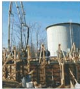
Contractele încheiate pentru anul 2005 au acoperit capacitățile de producție ale CIF Deva