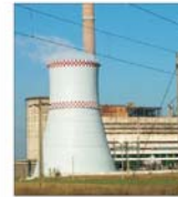
Modernizarea sistemului termic arădean necesită 3 miliarde RON