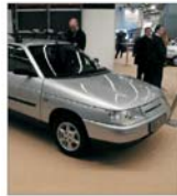
"AvtoVAZ", în mina statului rus?