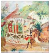
PLASAMENTE ALTERNATIVE De ce se moare?