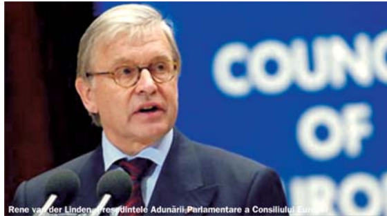
Rene van der Linden, președintele Adunării Parlamentare a Consiliului European

Avut CIA închisori secrete pe teritoriul României? - aceasta este problema la a cărei investigare, domnul Rene van der Linden, Președintele Adunării Parlamentare a Consiliului European, a solicitat cooperarea Parlamentului României, într-un discurs ținut, ieri, în fața senatorilor și deputaților reuniți. Scandalul centrelor de detenție CIA a fost declanșat de încheputul luni de "The Washington Post" în presa americană, care a dezvăluit că CIA i-ar interoga pe suspecți de terorism în închisori secrete aflate în opt țări străine (Thailandă, Afganistan), dar și în state din Europa răsăriteană. Ele nu au fost nominalizate ca să nu atragă acțiuni teroriste. Administrația americană nu a confirmat zvonul, dar s-a ferit să îl infirme. În aceste condiții, guvernele țărilor est-europene s-au simțit obligate să neghe public existența unor astfel de centre de detenție, ceea ce am făcut și noi prin vocea președintelui Traian Băsescu. Totuși, organizația "Human Right Watch" a lansat suspiciunea că Polonia și România ar fi gazdele unor astfel de închisori. Conform unui fost director al CIA în perioada 1977-1981) Stansfield Turner, Administrația Bush ar sprijini activ folosirea torturii la interogarea suspecților de terorism (și se presupune că tortura ar fi folosită în aceste închisori secrete). El a lansat zvonul că a dintr-o astfel de "locați negre" s-ar afla la not, în baza militară de la "Mihal Kogălniceanu". În ace-