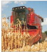
Prețul porumbului ar putea să scadă în continuare pe piața americană