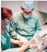
Spitalul privat devine o afacere profitabilă