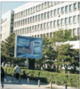
"Beta Cons" extinde publicitatea în zona hipermarketurilor