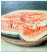
PLASAMENTE ALTERNATIVE Ce face, dom'le, Voicu?