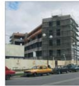
Centrele de afaceri nu mai aduc profit rapid