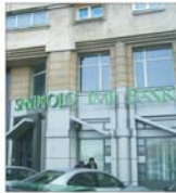
"Sanpaolo IMI" plătește 40,8 milioane de dolari pentru 80% din "Banca Italo Albanese"