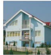
Soluții tehnice noi pentru construirea de locuințe