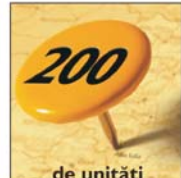
200 de unități în toată ROMÂNIA