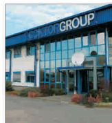
După 15 ani de activitate, "Contor Group" Arad se va lista la Bursă