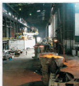
"Elsid" Titu a realizat o cifră de afaceri de 148.597.000 lei