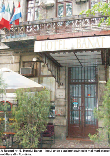
CA Rosetti nr. 5, Hotelul Banat - locul unde s-au înghesuit cele mai mari afaceri imobiliare din România.