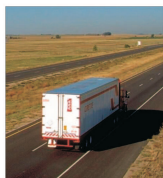
Comisia Europeană aprobă afacerea "Volkswagen" - "Scania"