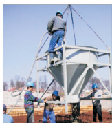
COMCM SA Constanța își majorează capitalul social cu 23,63 milioane lei