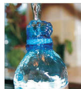
Lipomin Arad își propune să dubleze vânzările datorită cererii crescute de apă plată