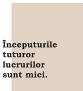
Începuturile lucrurilor sunt mici. Cicero