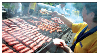
Poștiți la mici și promisiuni electorale!

electoral, mostenită de la alte alegeri, este perchea de așidăși.