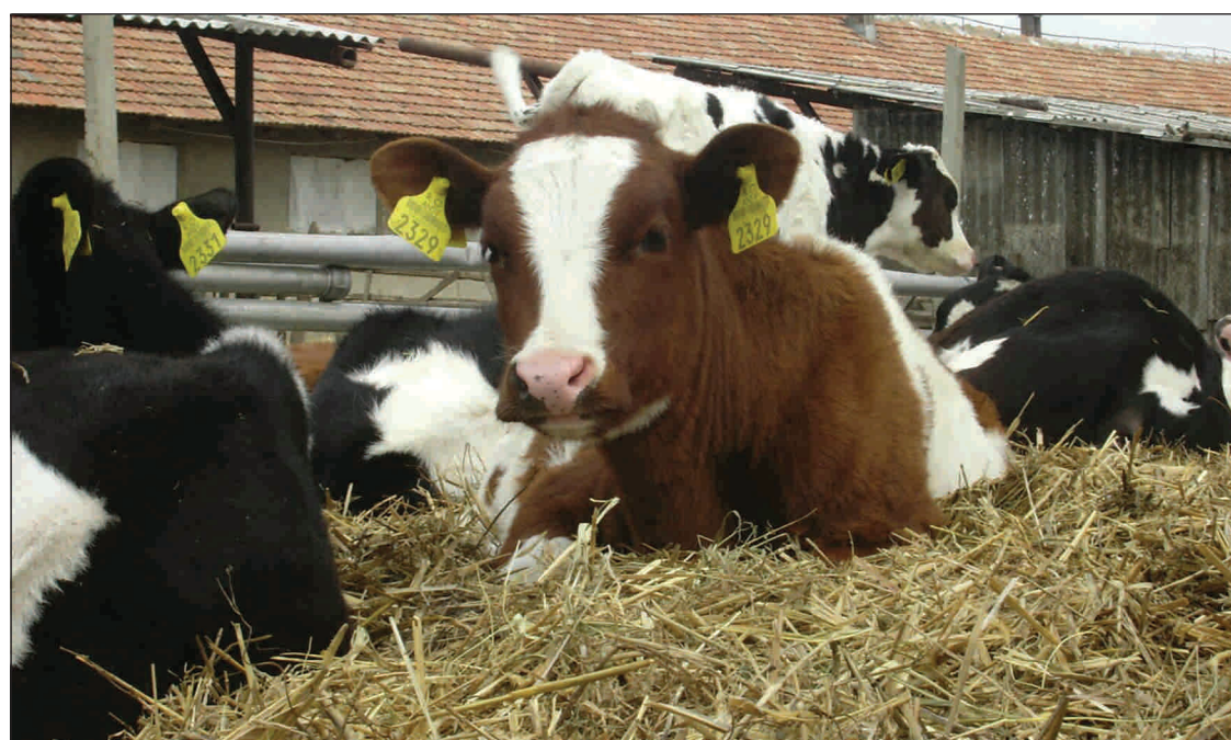
Alternativa la uzinele de îngrășăminte: vaca.

Industria chimică din țară resimte din plin efectele crizei economice și financiare internaționale, în pofida apelului la calm lansat de președintele Traian Bănescu, în vizitele sale la marile unități industriale. Pe fondul acestei crize, toate societățile industriale din țară se confruntă, la ora actuală, cu problema finanțării producției (băncile fiind ex-