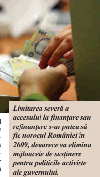
Limitarea severă a accesului la finanțare sau refinanțare s-ar putea să fie norocul României în 2009, deoarece va elimina mijloacele de susținere pentru politicile activiste ale guvernului.

deoarece ele au permis creșterea explozivă a creditării, fără a lua în considerare și riscurile asociate. De la începutul deceniului, ritmul de creștere al creditării din SUA a depășit cu mult ritmul de creștere al PIB-ului real. Refinanțările tot mai ieftine nu au obligat producătorii să-și plătească datoriile din veniturile realizate, dar acum a venit nota de plată. Autoritățile și-au asumat rapid meritele acestei așa-zise creșteri, care nu a fost decât tot un fel de schemă piramidală neustenabilă. Din această cauză, programele propuse pentru susținerea economiilor dezvoltate nu vor avea succes. Două ingrediente de bază ale pseudo-boom-ului economic din ultimii ani, încrederea și norocul, nu mai există pe piață pentru a susține aceste programe. Un mare "norocos" al ultimii decade, fostul prim-ministru britanic Tony Blair a recunoscut, în fața stu-