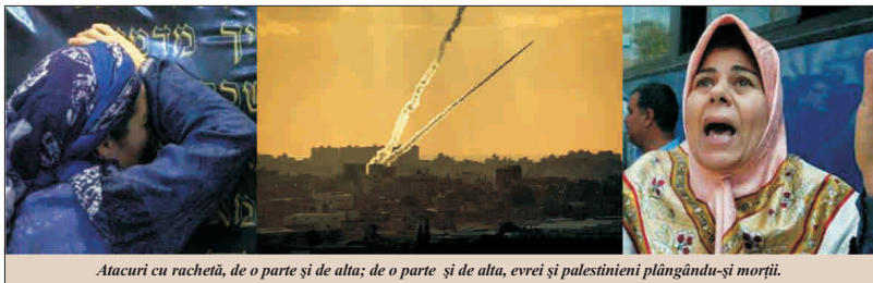
Atacuri cu racheta, de o parte și de alta; de o parte și de alta, evrei și palestinieni plângându-și morții.

M andatul lui Mahmoud Abbas, președintele Autorității Naționale Palestiniene, expiră vineri, 9 ianuarie, urmând să aibă loc alegeri. În Israel vor avea loc alegeri la 10 februarie. Pentru ambele părți, războiul din Fâșia Gaza contază drept campanie electorală. Este o campanie care bate recordurile cinismului, cu morți, răniți, cămine distruse. Armata israeliană luptă, de ieri, cu militanții Hamas în Fâșia Gaza, după