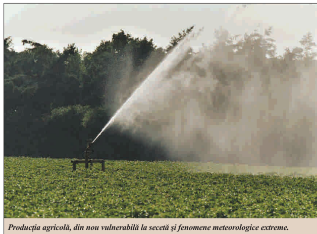
Producția agricolă, din nou vulnerabilă la secetă și fenomene meteorologice extreme.

● Agenția Națională de Îmbunătățiri Funciare, în insolvență ● Sistemul de irigații lovit de dezastru în acest an, previzionat a fi unul extrem de secetos