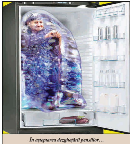
În așteptarea dezghețării pensilor...

● Sindicaliștii anunță greve în sănătate și educație