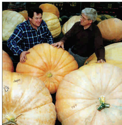
Dovleci umflați, îngrășăminte subvenționate - multă bucurie!

● Piața internă se deblochează după ce Guvernul va acorda fermierilor 400 de lei la hectar pentru achiziția de îngrășăminte chimice ● Combinatele chimice vor avea din nou comenzi din agricultură iar salariații din sector își vor păstra locurile de muncă ● Fermierii estimează producții apreciable, întrucât cantitatea de substanță activă utilizată la hectar se va tripla