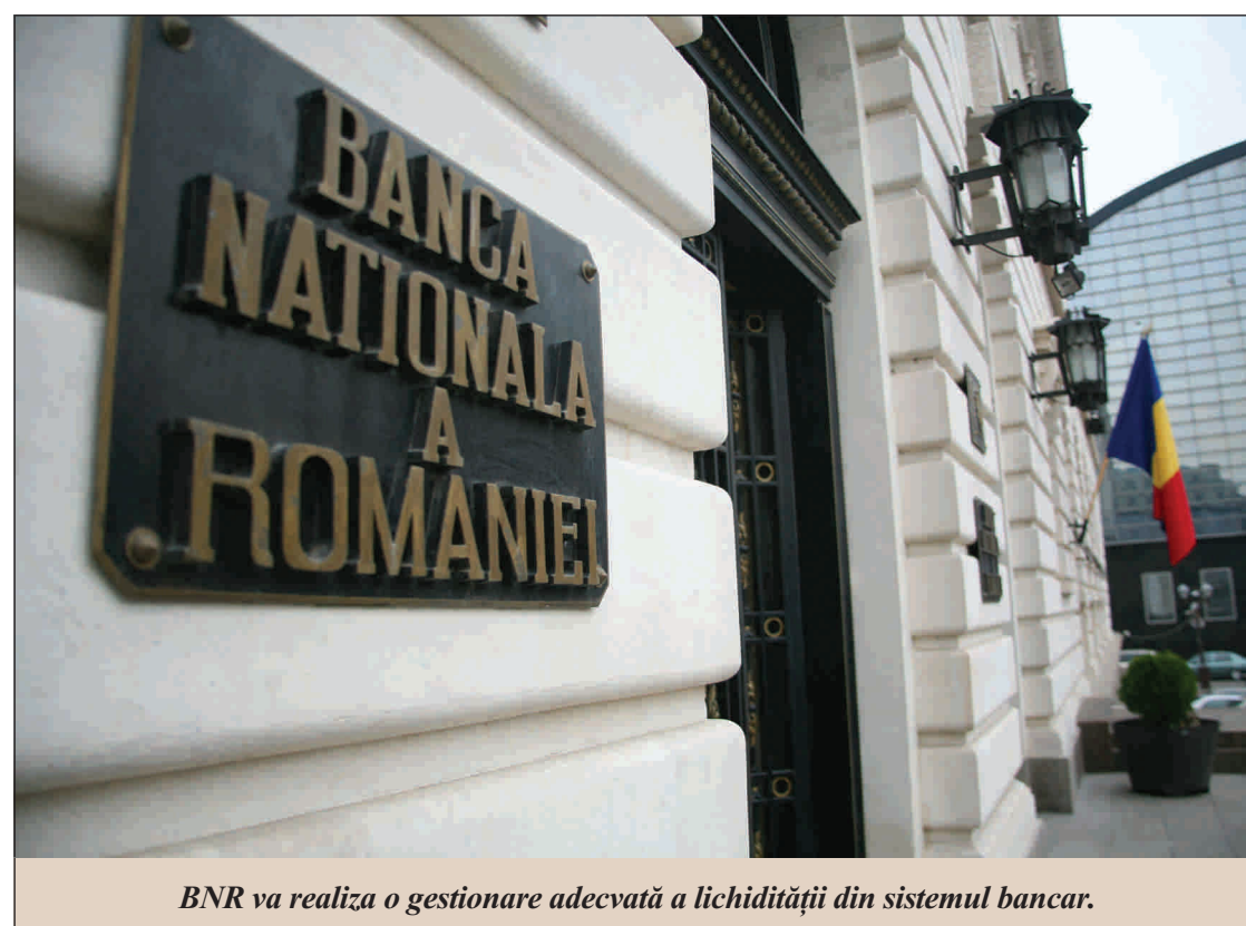
BNR va realiza o gestionare adecvată a lichidității din sistemul bancar.

● Analiștii spun că va scădea la 8,5%, la sfârșitul lui 2009