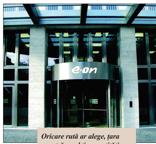
Oricare rută ar alege, țara noastră va obține cantități suplimentare de gaze pe termen lung.