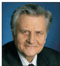
zută" în cazul actualei crize, ceea ce complică restabilirea încrederii în mecanismele pieței libere. (I.P.)

Trichet a spus, potrivit comunicatului, că "modelele și teoriile economice nu pot fi aplicate, iar evoluția viitoare nu poate fi prevă-