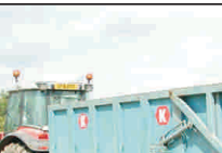
discursi și 67.600 de semănători de diferite tipuri.

capitolul număr de efective și performanțe