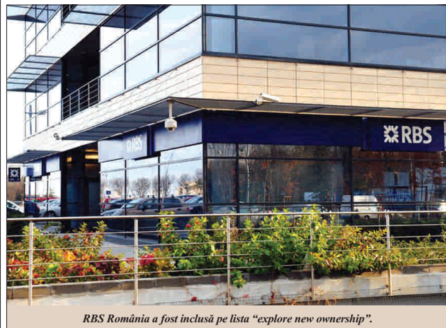
RBS România a fost inclusă pe lista "explore new ownership".

● Isărescu: Aveam de mai mult timp semnale privind vânzarea