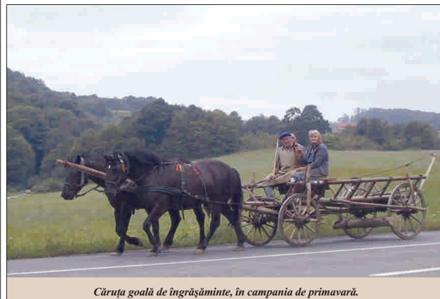
Căruta goală de îngrășăminte, în campania de primăvară.

D acă cineva și-a imaginat că sprijinul promis fermierilor pentru achiziția de îngrășăminte chimice va rezolva, dintr-un foc, atât problema combinatorilor chimice fără piață de desfacere, cât și cea a producțiilor mici la hectar din agricultura