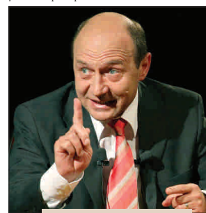
Traian Băsescu nu va da bani băncilor care vor să îi trimită în afară.

măsură de reducere a RMO, adică de relaxare a politicii monetare abia după ce politica fiscală se va întări.