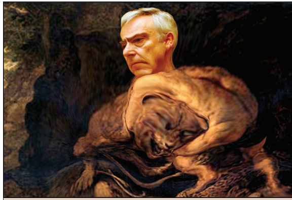
Guvernatorul, cu mușchii încordați (interpretare după Peter Paul Rubens - "Lupta lui Hercule cu leul din Nemea")

● BNR a tăiat dobânda-cheie cu jumătate de punct, la 9,5%