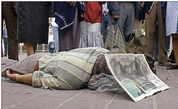
În timp ce FNI "lucrea" pentru ei, unii au adormit definitiv... (fotografie de la manifestațiile păgubiților FNI din anul 2000)

Nu mai contează că s-a amânat pronunțarea Curții de Casație și Justiție în cazul FNI, pentru ziua de 4 iunie.