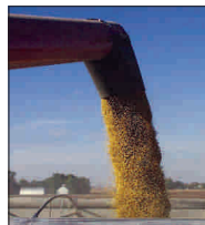
Numărul de exploatații agricole din țară reprezintă circa 28,7% în totalul din UE.

Fărămăntarea proprietăților agricole, evaziunea fiscală și asimetria puterii de negociere între producătorii și comercianții sunt câteva dintre trăsăturile definitorii ale pieței grâului de panificație din țara noastră, după cum reiese din forma finală a raportului Consiliului Concurenței pentru cunoașterea pieței cerealelor de panificație, intrat în posesia redacției. În țara noastră, grâul reprezintă