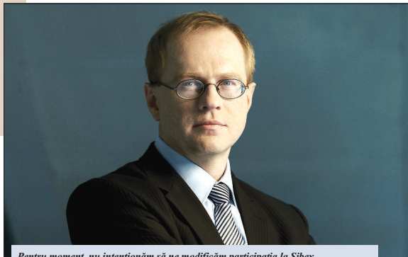
Pentru moment, nu intenționăm să ne modificăm participarea la Sibex.

Raportul arată rezistența pieței poloneze de IPO-uri, care nu s-a blocat