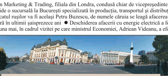
Precis că Gazprom ne va construi și Catedrala Neamului...

G igantul rus Gazprom, cel mai mare producător de gaze din lume, intră frontal pe piața românească a energiei electrice, după ani de zile în care doar ne-a tatonat piața, lucrând doar prin intermediari și doar pe sectorul de gaze naturale.