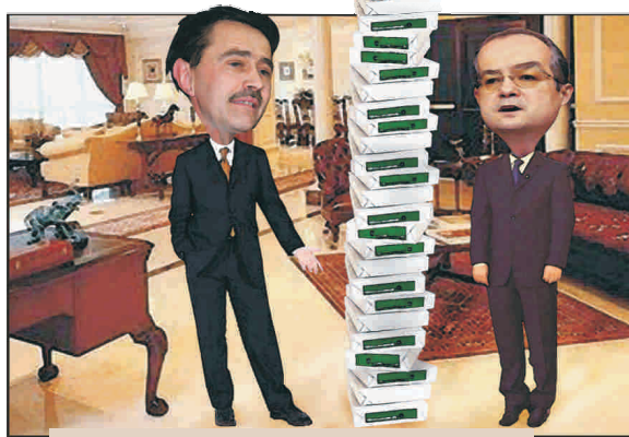
Pogea: Îmi trebuie 28 de topuri de hârtie ca să îi printez pe datornici. Boc: Nu risipi hârtie, e criză!

Tot la 30 iunie 2009, obligațiile restante la bugetul asigurărilor de sănătate ale marilor contribuabili au 9 pagini, iar cele ale contribuabililor mici și mijlocii - 3868 de pagini. (A.S.)