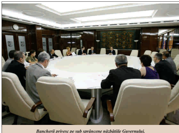
Bancherii privesc pe sub sprâncene năzbățiile Guvernului.

Băncile nu mai au încredere în Guvern; ieri, Ministerul Finanelor a vândut certificate de trezorerie cu scadența la un an în