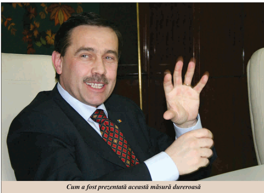
Cum a fost prezentată această măsură dureroasă

Discuțiile cu ziariștii au vizat, pe lângă restructurarea agențiilor din subordine, și problema trimiterii bugetarilor în concediu forțat, fără plată, - măsură care coincide, de altfel, cu o reducere salarială, când și așa