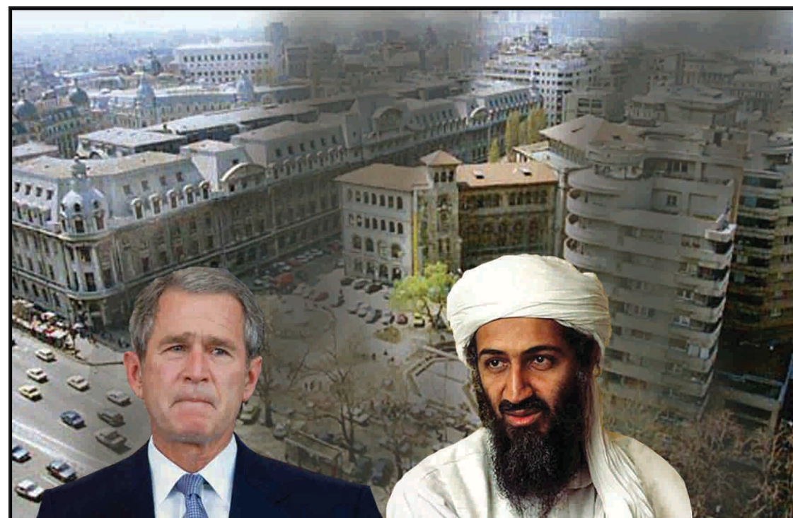
Conflictul dintre Bush și Bin Laden aruncă o umbră urâtă asupra Bucureștiului.

O clădire renovată de pe o stradă aglomerată din București a servit drept închisoare secretă a CIA, amenajată pentru găzduirea a maximum șase deținuți, declară fostul șef al principalei baze de aprovizionare a CIA din Europa, Kyle D. Foggo, citat de cotidianul american New York Times (NYT). Închisorile CIA au fost unele dintre cele mai neconvenționale progra-