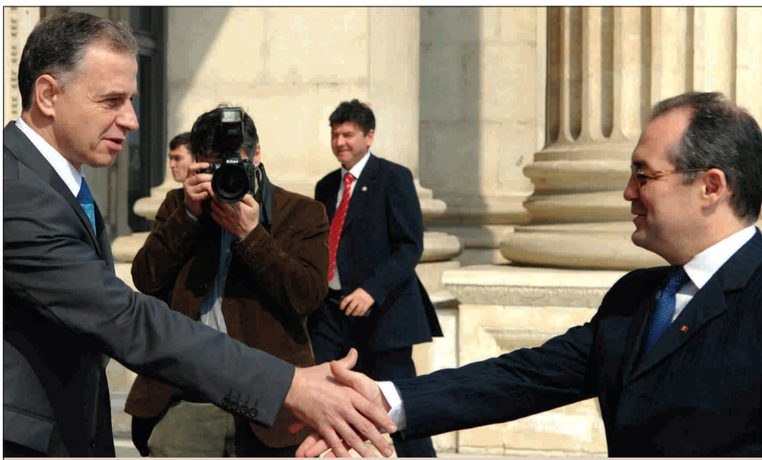
Mircea Geoană și Emil Boc și-au dat mâna pentru încă un program anticriză.

Potrivit anunțului lui Mircea Geoană, măsurile convenite în coaliție, aplicabile de la 1 septembrie, sunt: scheme