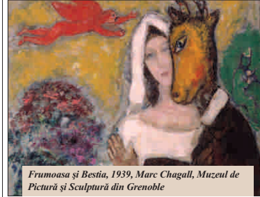
Frumoasa și Bestia, 1939, Marc Chagall, Muzeul de Pictură și Sculptură din Grenoble