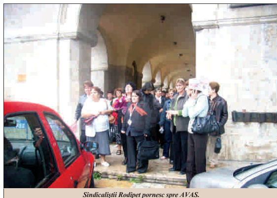
Sindicaliștii Rodipet pornesc spre AVAS.

Salariații fostei Rodipet - SC "Network Press Concept" SA - din toată țara au continuat și ieri să protesteze în