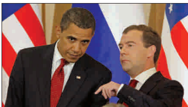
Barack Obama și Dimitri Medvedev, la Moscova, în luna iulie. Acesta este momentul considerat de specialiști că ar sta la baza deciziei actuale a administrației americane.

Sistemele Unite renunță la proiectul lor actual de scut antirachetă în Europa Centrală, după ce au revizuit în scădere așteptările iraniană, au anunțat ieri surse concordante, citate de AFP, după ce și oficialii celor două țări, Polonia și Cehia, implicate în proiect, anunțaseră, cu regret, iminenta decizie a Washingtonului.