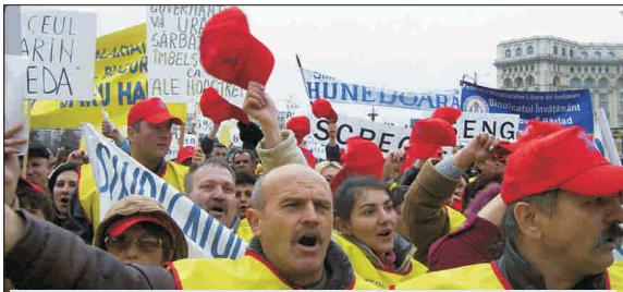
Guvernul intră în zodia protestelor

Confederațiile sindicale, încep, astăzi, acțiunile de protest împotriva Guvernului, solicitând, în primul rând, renegocierea Legii unice a salarizării în sectorul bugetar. Organizații estimează că 800.000 de sindicaliști vor intra în grevă generală, astăzi, iar miercuri, 7 octombrie, mai de sindicaliști sunt așteptați să participe la un miting de protest în Capitală.