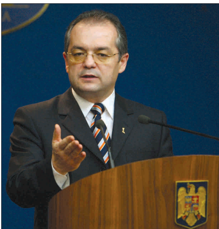
Premierul interimar Emil Boc: “România și-a respectat toate angajamentele. Nu este nevoie de o renegociere a acordului cu FMI”.

Banii din ultima tranșă ar urma să fie folosiți pentru plata pensiilor și a