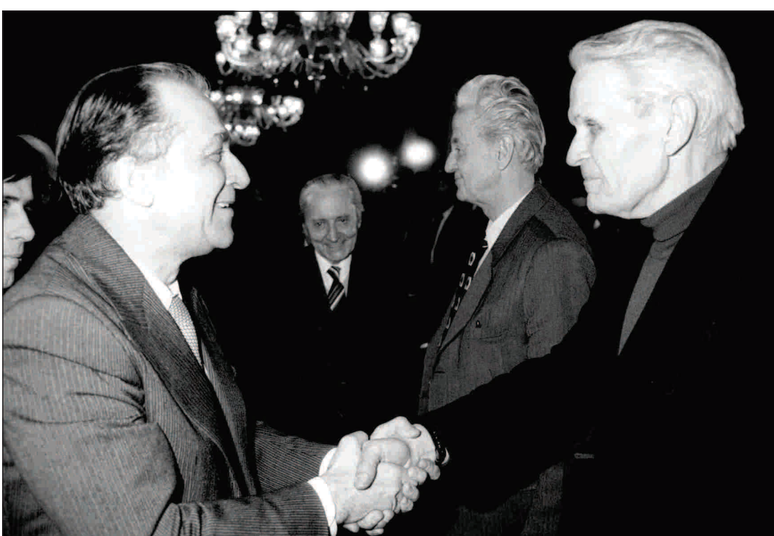
Se vede din fotografie că, în pofida anilor grei de temniță, Coposu a fost întotdeauna dispus să ierte.

Partidul Social Democrat își exprimă regretul pentru suferințele prin care a trecut poporul român în timpul comunismului și din cauza