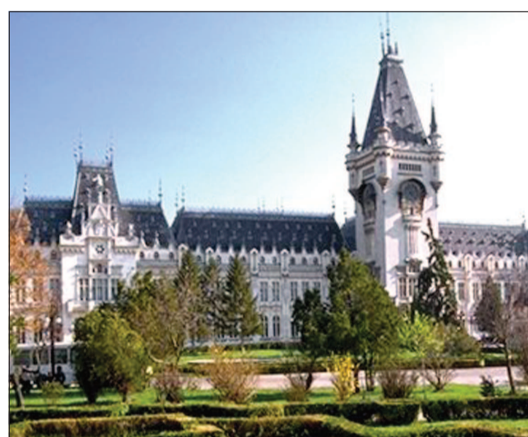
Cea mai mare emisiune de obligațiuni municipale listată la Bursa de Valori București aparține Municipiului Iași, fiind în valoare de 100.000 de lei.

Tranzacțiile cu obligațiuni și titluri de stat au depășit un miliard de lei