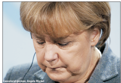
Cancelarul german, Angela Merkel

Prăpăstia dintre cuvintele și acțiunile lui Schäuble s-a evidențiat la