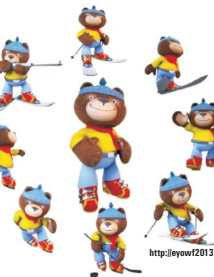
Martin (ursul carpatin) este mascota Festivalului Olimpic al Tineretului European 2013.

Luna viitoare, în țara noastră, va avea loc ediția de iarnă a Festivalului Olimpic al Tineretului European. Este cel mai mare eveniment sportiv pentru tineret găzduit de țara noastră în ultimii ani, dar cu toate acestea puțini sunt compatrioții noștri care au aflat de existența acestuia. Festivalul va avea loc în Brașov, Râșnov, Fundata, Poiana Brașov și Predeal, între 17 și 22 februarie, iar participanții se vor întrece la opt probe sportive: schi alpin, schi fond, biatlon, hochei pe gheață, patinaj artistic, patinaj viteză, sărituri cu schiurile și snowboarding. O astfel de competiție ar fi trebuit să fie însoțită de o întreagă campanie, care să impulsioneze turismul în zonă, dar autoritățile au fost mult prea ocupate după instalarea noului Guvern ca să găsească timp și pentru acest lucru. În ceasul al doilea, premierul Victor Ponta a decis că este necesară con-