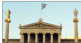
UE și FMI s-au angajat să susțină Grecia cu un total de 240 de miliarde euro din 2010, însă economia țării va fi în recesiune și anul acesta.

Documentul FMI notează că elenii nu au continuat, în număr extrem de