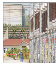
energia livrată în acest an.

PCB cunoscute, de asemenea, o tendință de scădere a prețurilor oferite de vânzătorii, care, în prezent, abia reușesc să realizeze contracte pentru energia cu livrare în bandă la un preț de 187 de lei/MWh, în condițiile în care luna noiembrie le-a adus contracte la prețurile de 230-240 de lei/MWh